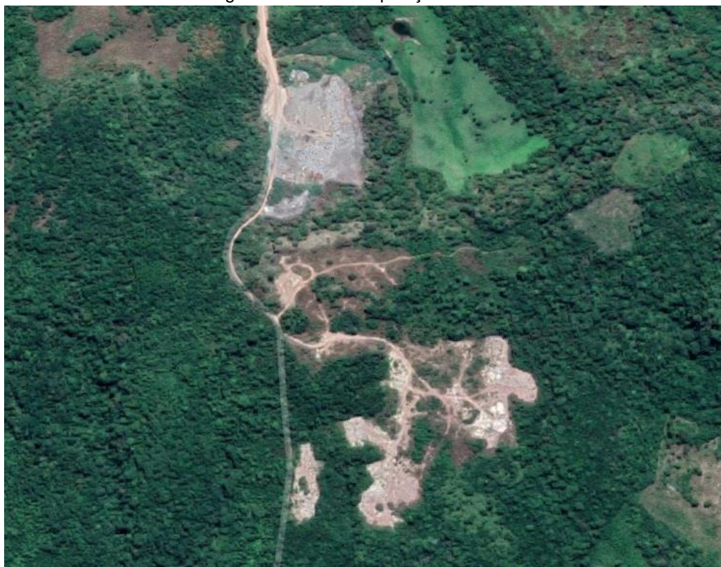
Figura 2: Área de disposição dos RSU

Os RSU serão depositados no local, conforme figura 2, distante da zona urbana aproximadamente 8,75 km (oito quilômetros e setecentos e cinquenta metros) ou em outro local previamente definido, com condições técnicas e ambientais mínimas para funcionamento, em distância não superior a 15 km (quinze quilômetros) da zona urbana. Todo e qualquer funcionário da Contratada, para a acessar o local, deverá estar devidamente trajado, usando os EPI's necessários às atividades em execução.